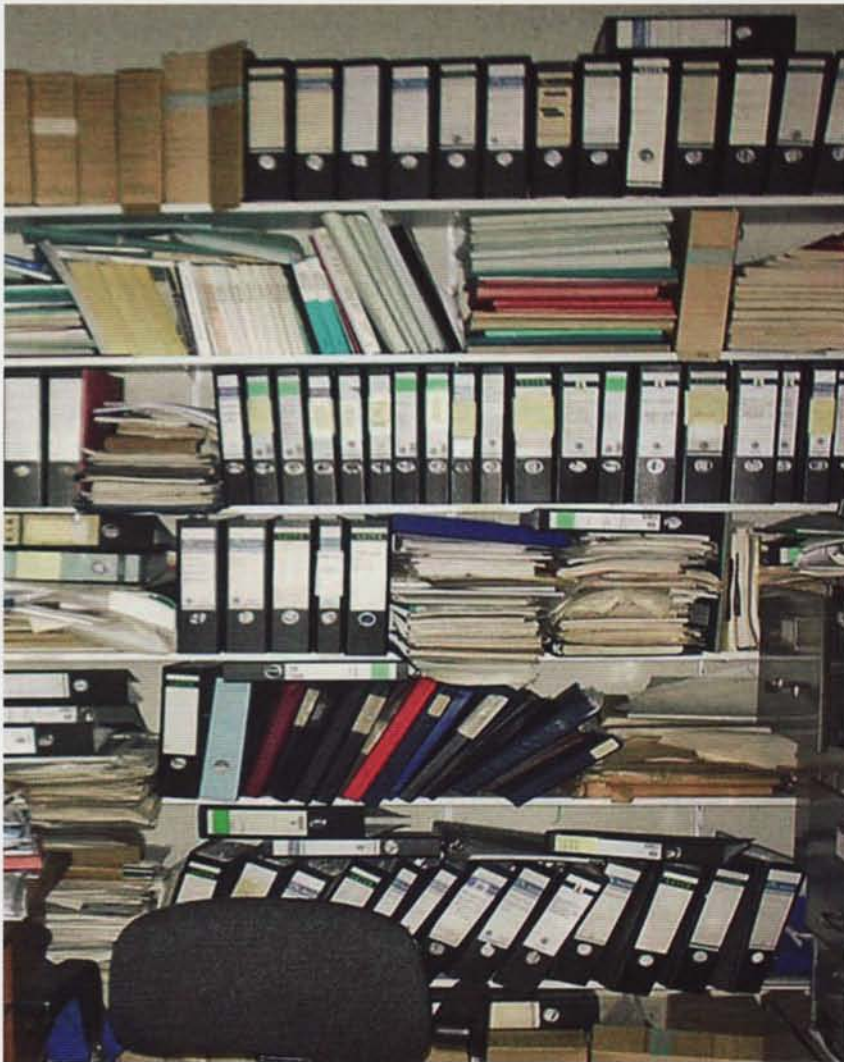
Een digitale back-up van papieren archieven kan veel ellende voorkomen.

'Een aantal bijzondere oude boeken zit in de brandkast, misschien dat die het heeft overleefd.' In het gebouw bevond zich de kaartenkamer van de bibliotheek van de TU Delft. Hier waren 12.000 papieren kaarten beschikbaar, waaronder topografische kaarten vanaf de negentiende eeuw, bodemkaarten, geologische kaarten, zeekaarten en diverse plankaarten. Bijzondere voor-