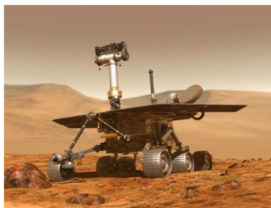
Rover Marswagen